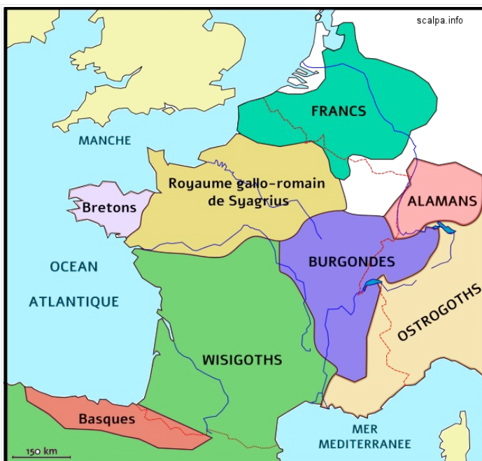
LA GAULE AU V ème ET VI ème siècle après J.-C.

En 476, l'Empire romain occidental s'effondra, submergé par les invasions barbares. Rome ne parvint pas à maintenir sa domination sur les territoires qu'elle avait autrefois contrôlés. L'Europe fut divisée entre les peuples barbares et les royaumes qu'ils avaient établis, tels que le royaume des Francs (précurseur de la France), le royaume des Alamans (précurseur de l'Allemagne) et le royaume des Bretons (précurseur de la Bretagne).