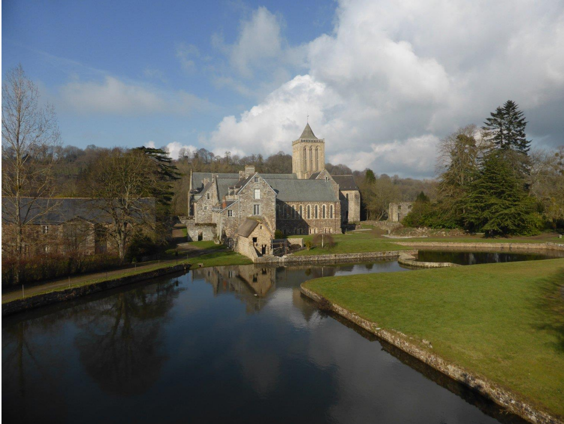
L'abbaye de La Lucerne-d'Outremer.

L'abbaye Sainte-Trinité de La Lucerne est une ancienne abbaye de l'ordre des Prémontrés, située sur le territoire de la commune de La Lucerne-d'Outremer, dans la Manche. Construite dans la seconde moitié du XII e siècle, elle fut restaurée au XV e et au XVII e siècles.