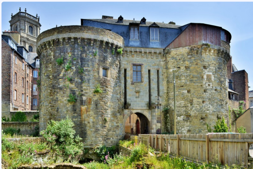
Les tours de l'ancienne enceinte de Rennes.

Rennes possède un riche patrimoine architectural : rues pavées, maisons à colombages, cathédrale Saint-Pierre et place des Lices.