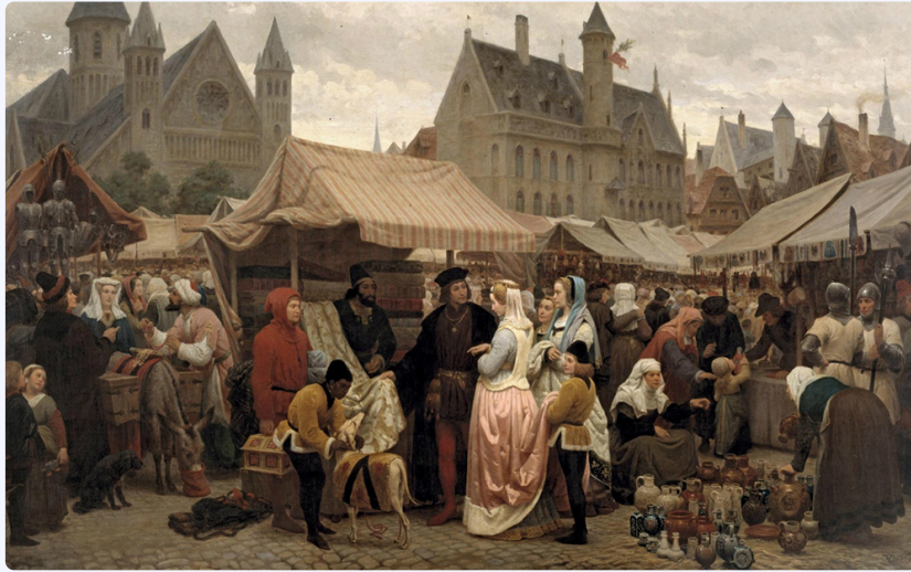
Une foire à Gand au Moyen Âge.

La vie urbaine médiévale est organisée autour de nombreuses activités économiques, sociales et culturelles. Les places centrales servent de lieux de rassemblement et de marché . Les artisans locaux et les paysans des alentours viennent y vendre leurs produits.