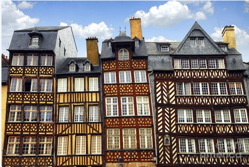
Façades à colombages de Rennes.